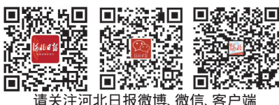
请关注河北日报微博、微信、客户端

上,近岸海域水质达到国家二类海水水质标准,浴场水质优于国家二类海水水质标准,陆域主要污染源基本得到控制,入海河流污染加剧趋势得到有效控制,确保暑期北戴河近岸海域海水质量好于去年同期。投入2000万元,开展美丽乡村片区建设攻坚战。暑期前高标准完成北戴河区7个村庄的美丽乡村建设任务,实现农村布局优化、民居美化、道路硬化、村庄绿化。(下转第五版)